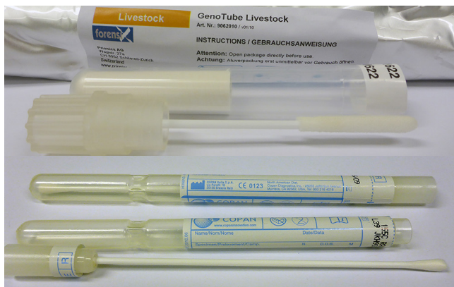
Abb. 1: Tupfer für die Probennahme (oben Genotubes der Fa. Prionics, unten Baumwolltupfer der Fa. COPAN)

In den am NRL für Schweinepest durchgeführten Validierungen erwiesen sich die als forensische Tupfer entwickelten Genotubes (Prionics) als sehr gut geeignet (schnelle Trocknung der Probenmatrix, einfache und kontaminationsarme Handhabung beim Abschneiden eines Fragmentes, sehr gute Lagerfähigkeit bei Raumtemperatur). Es sind jedoch auch andere Trockentupfer (z.B. einfache Baumwolltupfer) verwendbar.