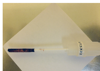
Abb. 2: Blutgetränkter Tupfer (Genotube, Prionics)

Details zur Validierung sind beim NRL für ASP am Friedrich-Loeffler-Institut, Riems, zu erfragen.